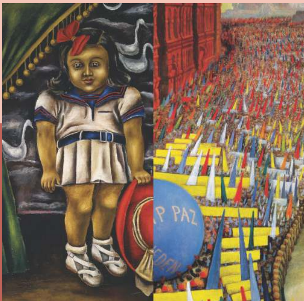
Niña con sombrero rojo María Izquierdo 1942 Óleo sobre tela Col. Sura Art Corporation